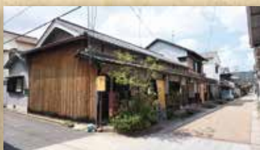
久宝寺3丁目大水路長屋

「八尾きらり」 良好な景観をつくり出している建築物や工作物・樹木などの景観資源を市が誇るべき「八尾きらり」として登録し、保全や利活用を幅広く推進すると同時に、市内外の方々に、その魅力を発信していくというものです。 久宝寺地区では、現在11件の古民家が登録されています。詳細はページ